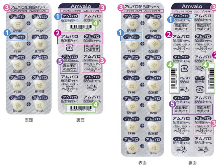
14錠 PTP シート