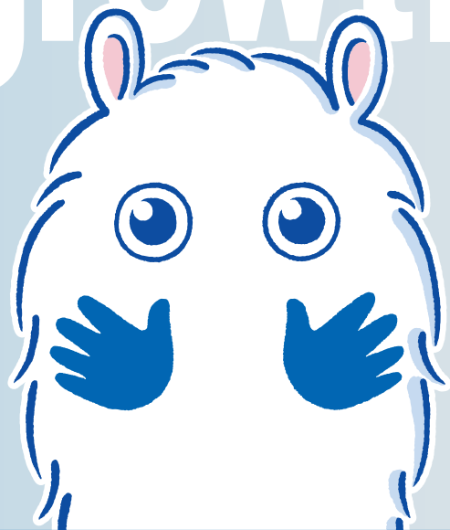
たなみん 田辺三菱製薬 キャラクター

田辺三菱製薬グループの健康支援サイトでは、疾患や治療の大切さについて多くの方々に知っていただきたく、病気の症状や治療に関する情報、患者さんやご家族の日常生活をサポートするお役立ち情報などを、イラストも交えてわかりやすく紹介しています。