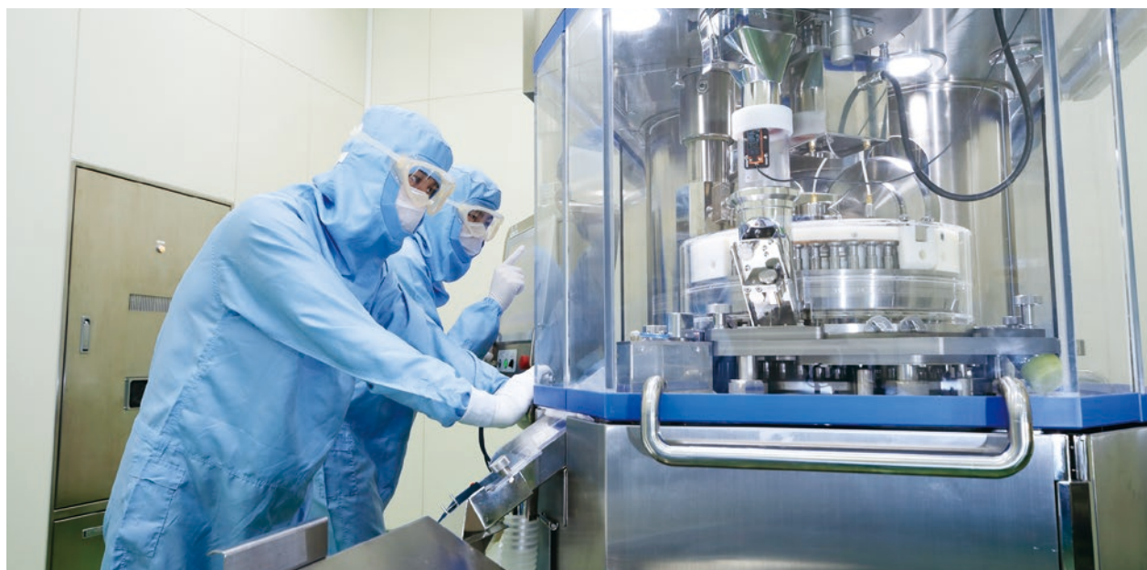
固形製剤工場(吉富工場内)

また2017年9月には、BIKEN財団のワクチン製造事業を基盤とした合弁会社「BIKEN」が操業を開始し、BIKEN財団のワクチン製造技術に、当社の医薬品生産に関するシステムや管理手法等を融合して生産基盤を強化することで、ワクチンの更なる安定供給への貢献を図っています。