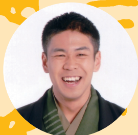
桂米紫 「イモリの黒焼き」