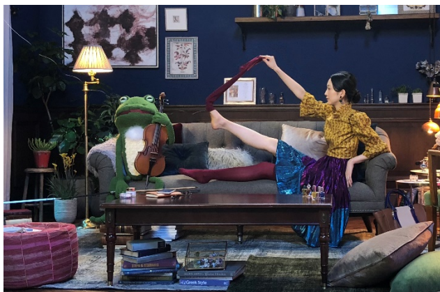
テレビ CM の撮影風景

「コート f ® レグケア」は、秋冬の乾燥が気になる季節に向けて、10 月よりテレビ CM を放映します。テレビ CM には、粉ふき乾燥肌に悩む女性の日常の一コマに、かわいらしいカエルが登場。歌に乗せて製品の特長を印象付けます。また、このカエルはウェブサイトやドラッグストア店頭の販促物にも登場し、乾燥に悩む女性の味方として、適切な治療法の啓発に貢献します。