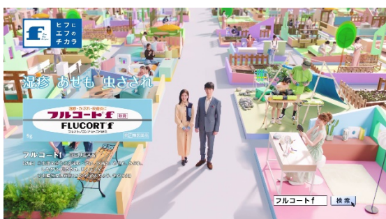
「いつも、そばに。フルコート f。」