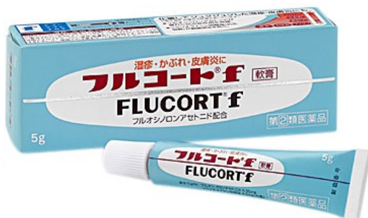
フルコート® f 5g

「フルコート® f」はストロングランクの外用ステロイドである「フルオシノロンアセトニド」を配合。優れた抗炎症作用で「炎症の悪化サイクル」を断ち、赤み、腫れなどの症状を抑え、かき壊しによる悪化を抑えます。また、抗生物質「フラジオマイシン硫酸塩」が患部の細菌増殖を抑え、化膿してジュクジュクした患部にも使用できる軟膏タイプの皮膚治療薬です。