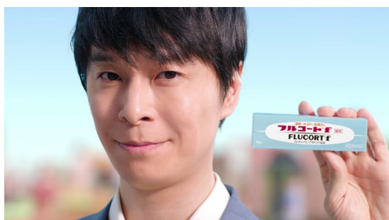
「まずは早めのフルコート f。」