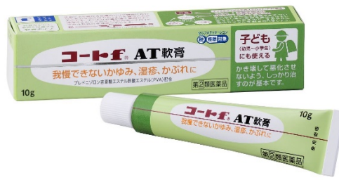
コート f ® A T軟膏 10g