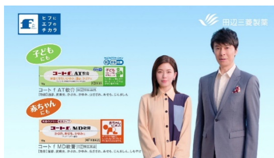
「子ども、赤ちゃんにも。」