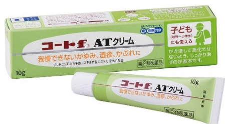
コート f ® A Tクリーム 10g

「コート f ® A T軟膏／クリーム」は、お子さんにも使える効き目が穏やかな外用ステロイド「プレドニゾロン吉草酸エステル酢酸エステル(アンテドラッグ)」やかゆみ止め成分などを配合。