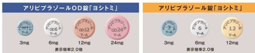
※製剤写真は印刷の都合上、色調が実物とは多少異なることもあります。